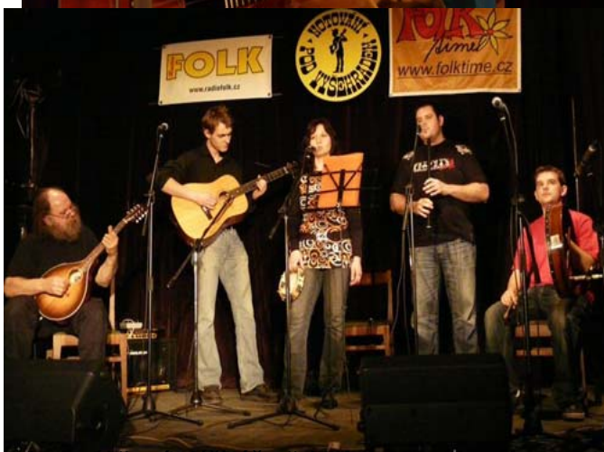
Kapela z vesnice s názvem Bublina. Navíc jsem kapil po Nětrčán chládku a stičerka kolou sístre