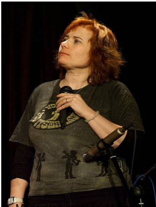
Musikantka z kapely Bublina uvedli na scénu